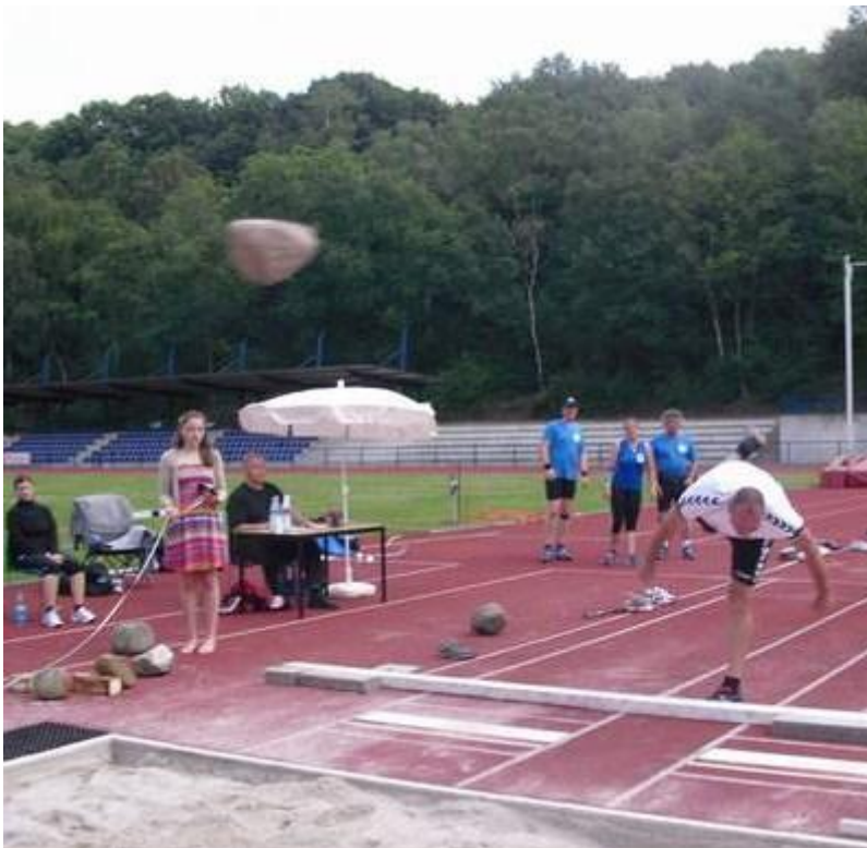
Ein Teilnehmer beim Steinstossen