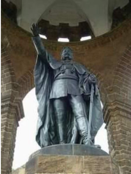
Kaiser Wilhelm der Große

Unter der schützenden Hand von Kaiser Wilhelm I. (der Große) und quasi im Schatten der Porta Westfalica gab es für die Mitglieder und Freunde des Fördervereins bei den am vergangenen Wochenende stattgefundenen Deutschen Senioren-Leichtathletikmeisterschaften in Minden/Westfalen einen wahren Medaillenregen.