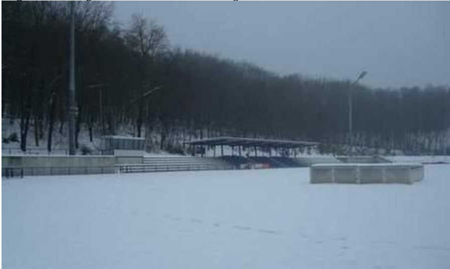
Rather Waldstadion Ende Dezember 2010

Während die Fussballer in überdachten Arenen problemlos ihre Turniere austragen können, gleichen Leichtathletik-Anlagen verlassenen Landschaften.