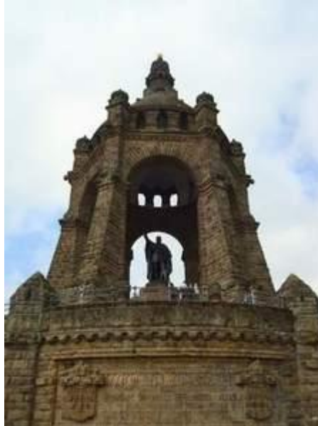
Porta Westfalica mit Kaiserdenkmal